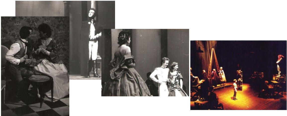
Amour et Colère, Aguettant & Grasset 1984 – 1987