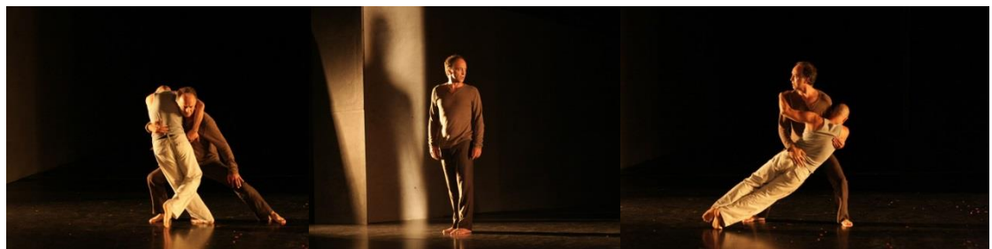
La Première Seconde, Creación Colectiva 2008 – 2009