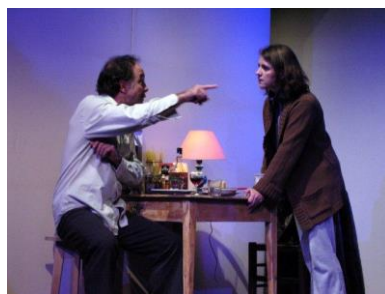
Skylight de David Hare, 2003 – 2006